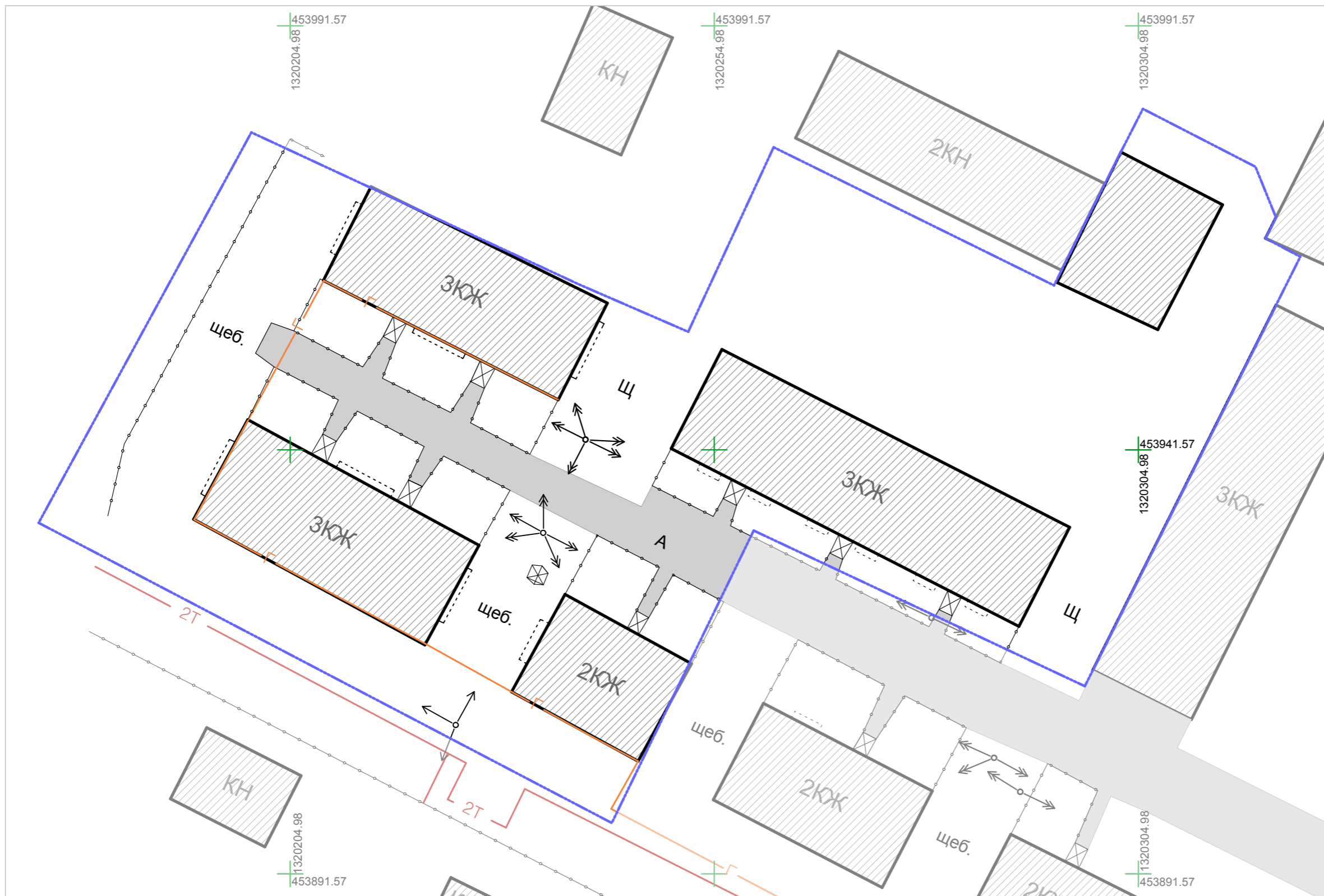
Схема использования территории в период подготовки проекта планировки территории (Опорный план)